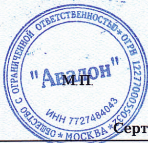
Схема сертификации: 1с.